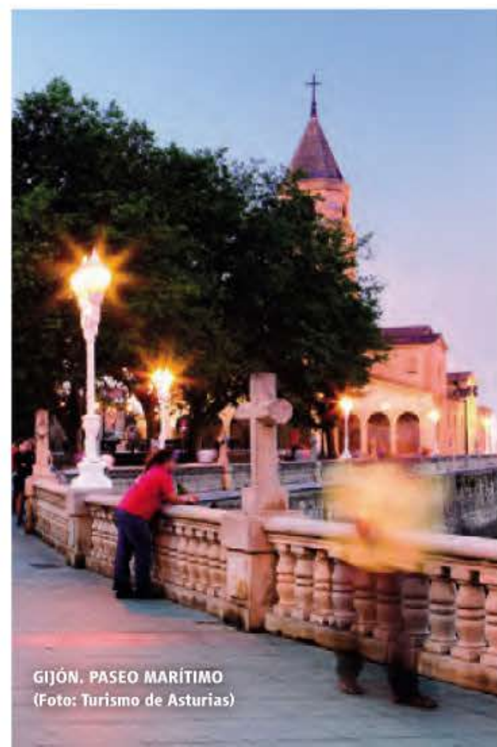
GIJÓN. PASEO MARÍTIMO