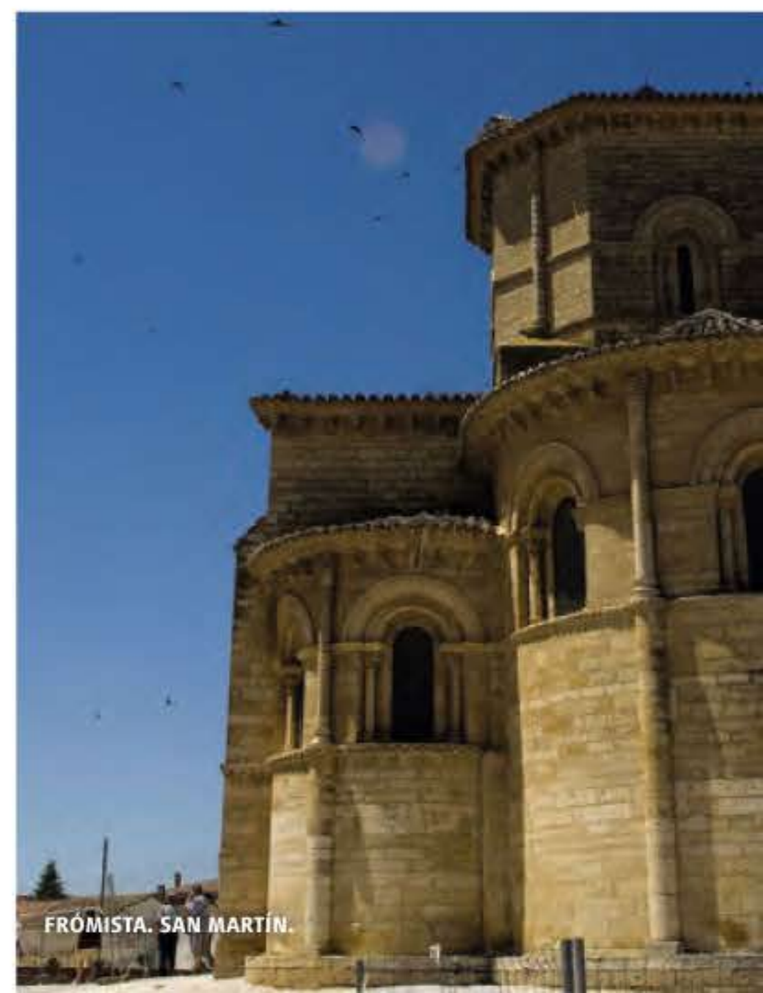
FRÓMISTA. SAN MARTÍN.